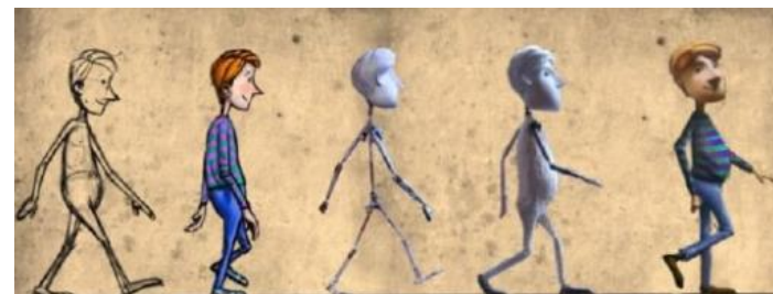
Этапы создания мультфильма